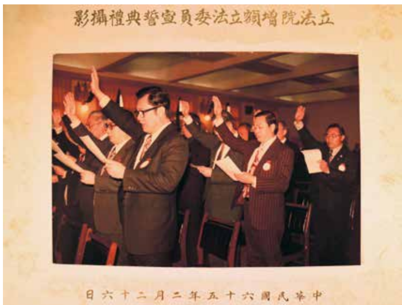
圖四 1976年（民國65年）劉松藩當選增額立委就職宣誓

擔任財政部部長時期，沒有及時妥善處理十信負責。財政部部長陸潤康則於同年8月去職，其他有15名政府官員受到記過、調職等處分。