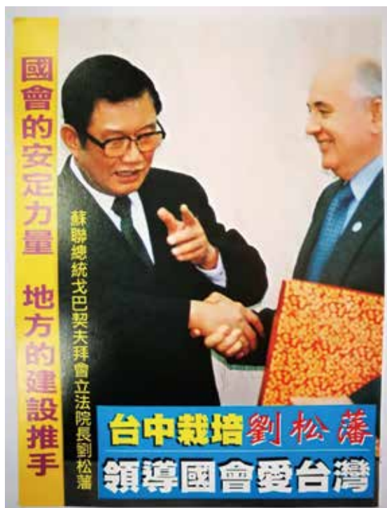
圖九 1994年（民國83年）蘇聯前總統戈巴契夫（Mikhail Sergeyevich Gorbachev）來訪

四、1995年（民國84年）的國會外交活動：首先，在9月14日，劉松藩出訪薩爾瓦多（Republic of El Salvador），總統表達其對我加入聯合國的支持。來訪的外交活動如下所示。