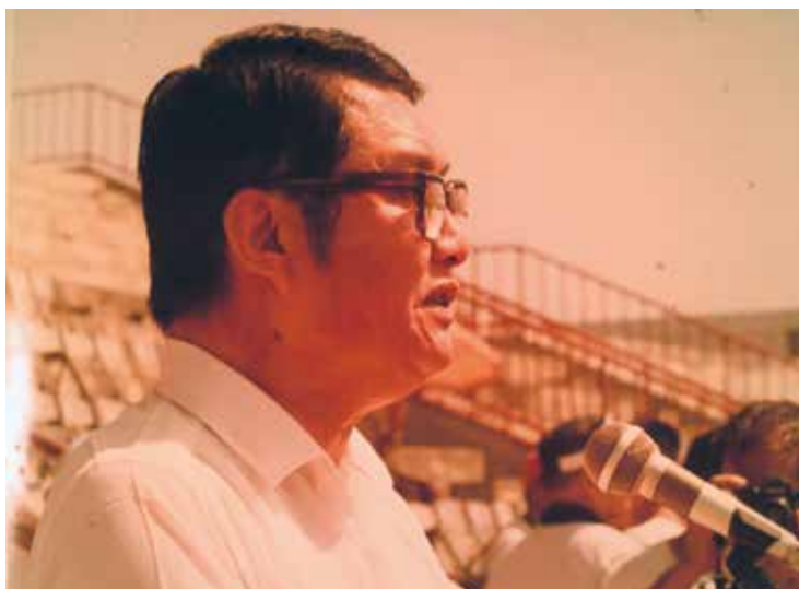
圖三 1973年（民國62年）剛當選立法委員的劉松藩

年）1月至1999年（民國88年）2月期間還擔任中華民國立法院院長， 14 有其政治實力。劉松藩擔任立法院院長之後，因在臺北的時間較長，對地方上之事務無暇全力領導，遂逐漸退居幕後，由當時擔任省議員的姪子劉銓忠，與當時擔任臺中縣長的廖了以二人掌握領導權。