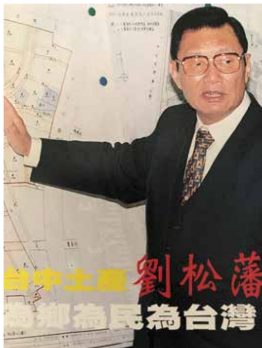
圖十四 1995年（民國84年）劉松藩積極為地方建設奔走

僵局，劉松藩即宣布暫停休息10分鐘，各黨派代表出來協商，到立法院議場最後面的院長休息室討論，取得共識後再繼續會議。還有國是論壇程序發言，也大大降低議事延宕的機率。在第三屆院長任內，民進黨籍立法委員有50餘席，劉松藩與民進黨主席施明德的關係也非常好，這要歸功劉松藩的人格特質，他在立法院有13兄弟，在臺中縣地方上有18兄弟，擁有豐沛人際網絡和折衝協商的能力。 156