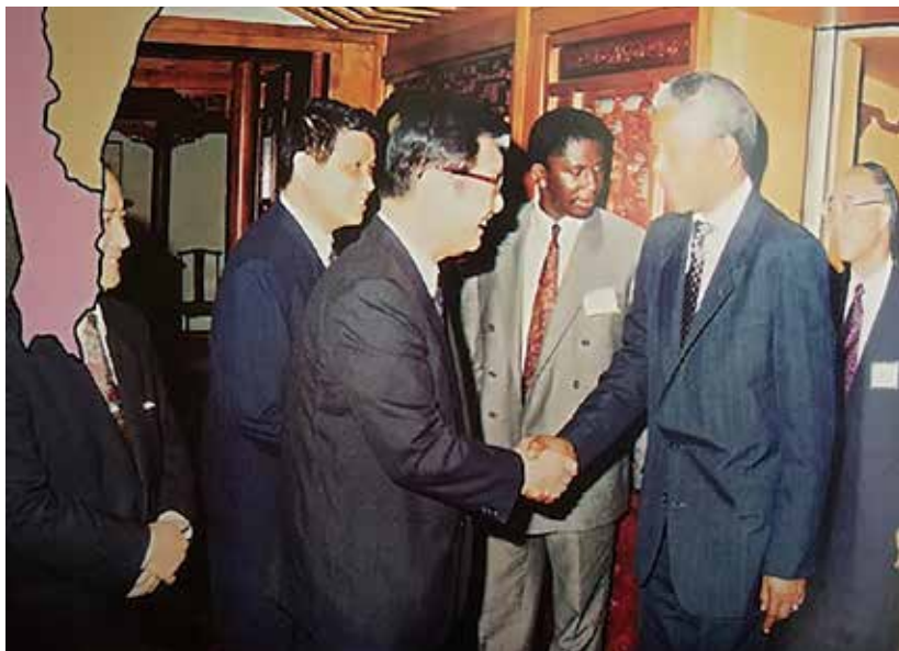
圖十一 1996年（民國85年）南非總統曼德拉（Nelson Rolihlahla Mandela）率國會憲政委員會來訪