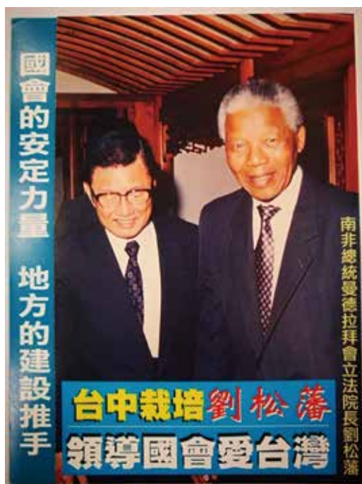
圖十 1996年(民國85年)南非總統曼德拉(Nelson Rolihlahla Mandela)率國會憲政委員會來訪